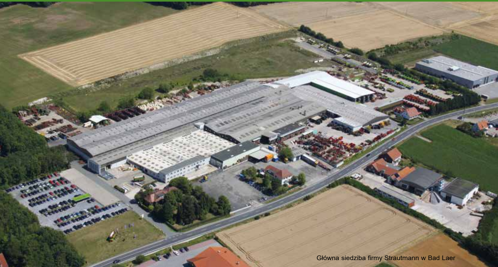
Główna siedziba firmy Strautmann w Bad Laer

Przedsiębiorstwo B. Strautmann & Söhne GmbH u. Co. KG jest rodzinną firmą średniej wielkości istniejąca od ponad 80 lat a mającą swoją siedzibę w południowej części Dolnej Saksonii. Firma Strautmann posiada drugą lokalizację swej produkcji, która znajduje się w Polsce. We Lwówku Wielkopolskim wybudowano nowoczesny zakład, w którym obok poje-